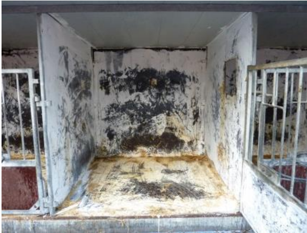
Figur 1a. En boks inden grovspuling.