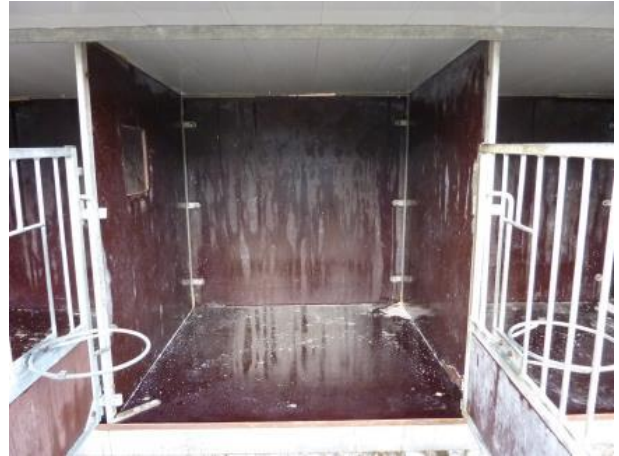
Figur 1b. En boks efter rengøring med vand, sæbe og desinfektion.